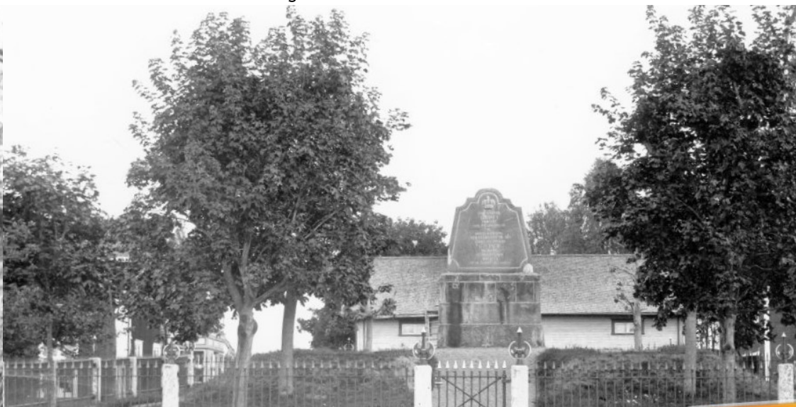
Bild XJF00458 på dibis.se: För 500 år sedan talade Gustav Vasa till Norrala-bönderna från en kulle i Kungsgården, han ville ha deras hjälp i kriget 1521 mot den danska unionskungen. 1773 restes Vasamonumentet till minne av detta.

Söndag 19/9, kl 15. Ord och bild av Roger Bergström. I Skärså skola. En historisk beskrivning av fisket som yrke och bisyssla till jord- och skogsbruket i Norrala kommun.