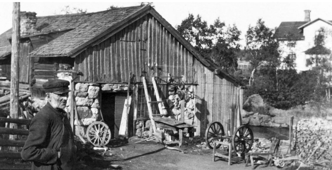
Bild XVA00721 på dibis.se: Per Norin vid Kungsgårdens smedja för 100 år sedan. Fotograferad av Svante Söderblom, på besök från USA i september 1921.

Måndag 26/7, kl 18. Servering. Söderhamns Spelmansgille spelar.